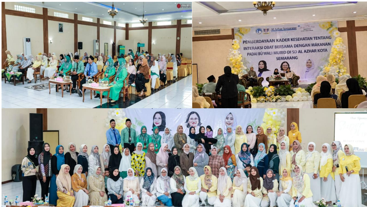
Gambar 1. Pelaksanaan Kegiatan

Tahap pelaksanaan diawali dengan pembukaan kegiatan dan pengisian pre-test oleh peserta untuk mengetahui tingkat pengetahuan awal terkait penggunaan obat. Selanjutnya, dilakukan penyuluhan kesehatan melalui ceramah interaktif yang membahas konsep penggunaan obat rasional, aturan dan waktu minum obat, serta jenis makanan dan minuman yang dapat berinteraksi dengan obat. Kegiatan dilanjutkan dengan praktik membaca label dan etiket obat menggunakan contoh kemasan obat, sehingga peserta dapat memahami informasi penting seperti aturan pakai, peringatan, dan waktu konsumsi obat. Diskusi dan tanya jawab juga dilakukan untuk memberikan kesempatan kepada peserta menyampaikan pengalaman dan permasalahan yang sering dihadapi dalam penggunaan obat sehari-hari. Sebagai penguatan materi, peserta diberikan leaflet edukasi yang dapat digunakan sebagai bahan bacaan di rumah. Antusiasme peserta terlihat dari keaktifan dalam diskusi serta banyaknya pertanyaan yang diajukan selama kegiatan berlangsung.